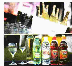
Freixenet i Jana službeno piće festivala